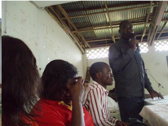
Accueil à la salle des fêtes, et mot du Maire adjoint de Ngambé