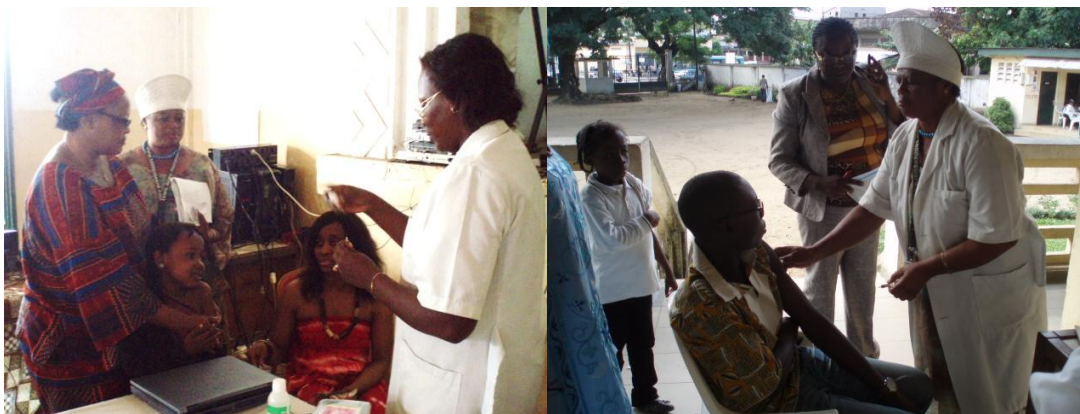
Vaccination Pneumo23 financée par Drépavie (50 enfants de 2 à 15 ans vaccinés)