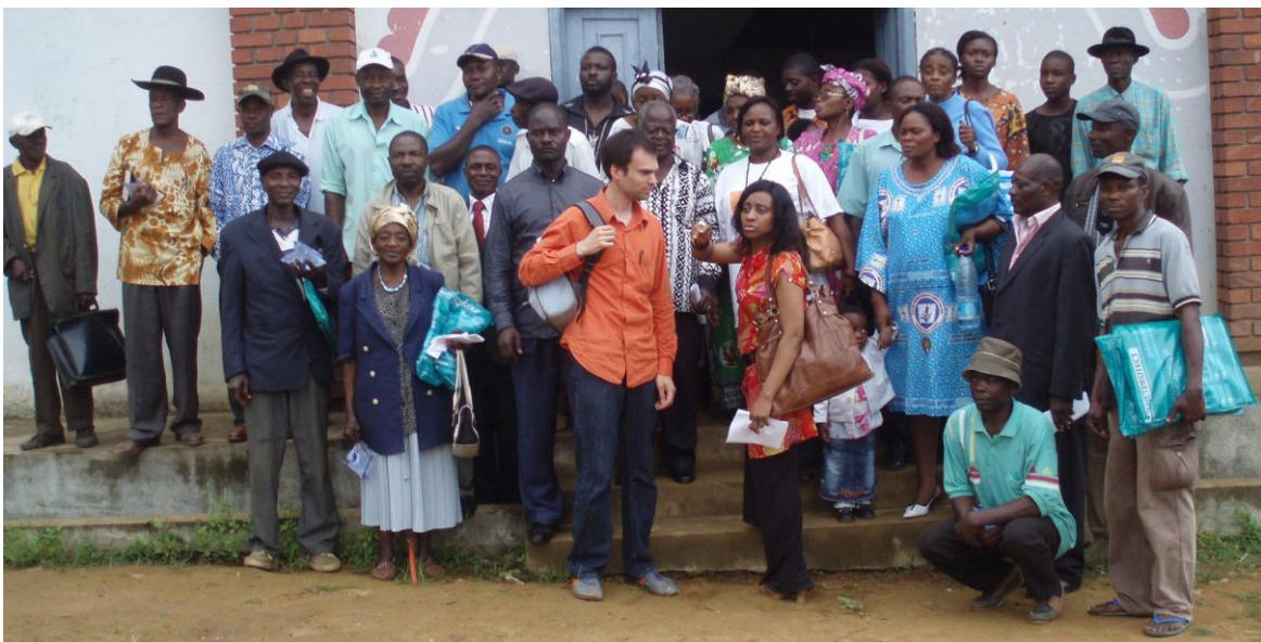
Photo de groupe des participants à la discussion

Don de 5 brochures pédagogiques et d'éducation sur la drépanocytose (« Bobby et ses 12 conseils sur la drépanocytose ») – donnée uniquement au personnel médical