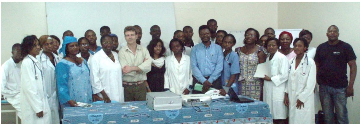
Photo du groupe participant à la formation des médecins de la matinée